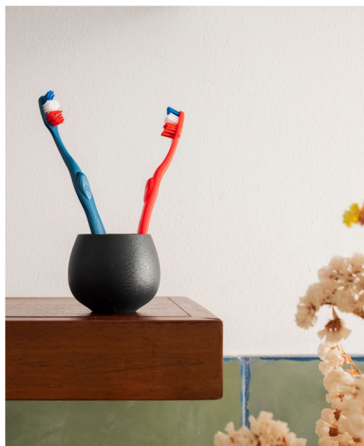
1 et 2. Dupont , manche en plastique recyclé et recyclable - 4,03€