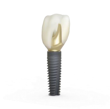
Fig. 3 : Les participants pourront participer à plusieurs ateliers pour voir en action les nouveaux produits de Dentsply Sirona, tels que le système d'implants DS PrimeTaper.