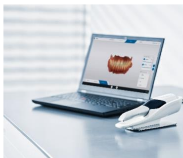
Fig 2 : Primescan Connect