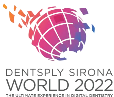
Fig 1 : la conférence DS World 2022 s'est déroulée du 15 au 17 septembre au Caesars Forum à Las Vegas, Nevada.

sont disponibles en > Téléchargement sur le site web.