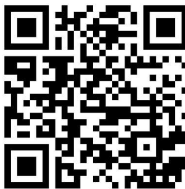
Fig. 2: Scannez le code QR pour accéder au lien everysmile.org/dentsplysirona et contribuer à battre le record mondial du Guinness des Records.