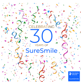
Fig. 1 : Les 30 ans de la solution SureSmile

sont disponibles en téléchargement sur le site web.